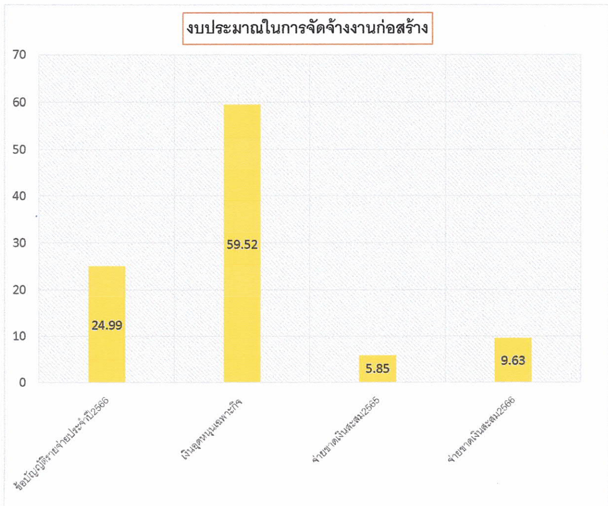
แผนภูมิ ๒ แสดงร้อยละของงานก่อสร้างประจำปีงบประมาณ พ.ศ. ๒๕๖๖ จำแนกตามแหล่งที่มาของงบประมาณ